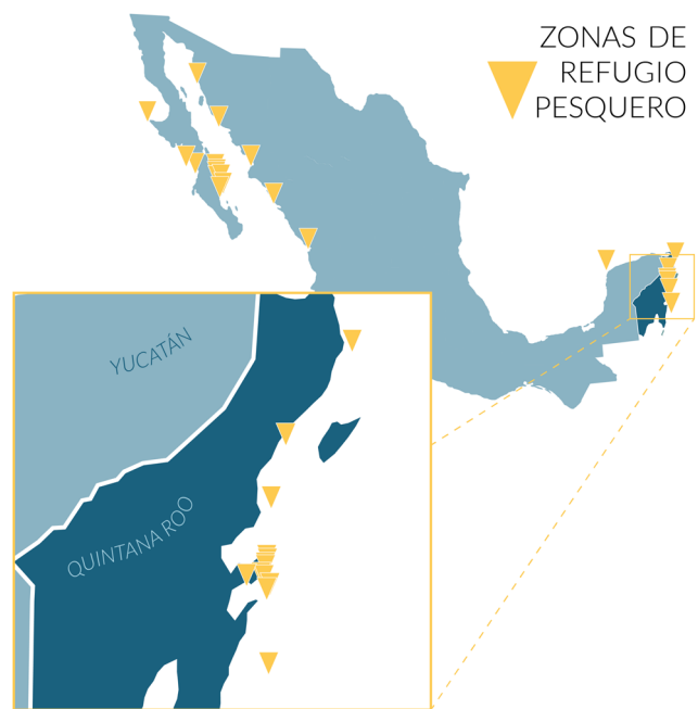
Acercamiento a la localización de las zonas de refugio pesquero impulsadas por la Alianza Kanan Kay.

El presente documento es una guía para las personas físicas o morales en el proceso de solicitar el decreto de una zona, o una red de zonas de refugio pesquero (ZRP) en aguas de jurisdicción federal. Se presentan de manera general los pasos a seguir según lo establecido en la Norma Oficial Mexicana NOM-049-SAG/PESC-2014 , que determina el procedimiento para establecer zonas de refugio para los recursos pesqueros en aguas de jurisdicción federal de los Estados Unidos Mexicanos.