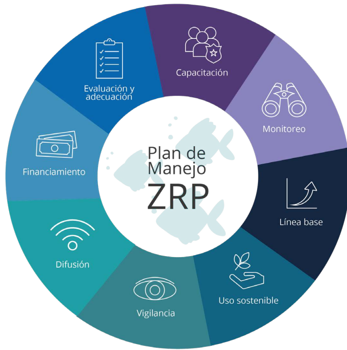
Diagrama "Componentes del Plan de Manejo de una Zona de Refugio Pesquero". Elaborado por Caamal J. y Fulton S, 2019. Los datos e ideas son extraídos de documentos elaborados por Comunidad y Biodiversidad, así como de la experiencia de trabajo de esta organización. Documentos citados: Suarez, A. et al. 2016, Evaluación del diseño de la estrategia de trabajo de COBI, A.C. OIDES, S.C. 2015; Diseño e implementación de zonas de refugio pesquero en México a partir de la participación del sector productivo, presentación en Foro Científico de Pesca Ribereña, INAPESCA.

Componentes del plan de manejo de una zona de refugio pesquero.